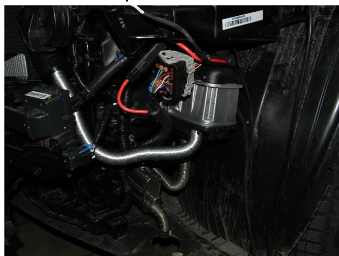
Thermo Top Evo