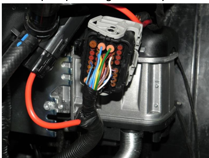
wiązka elektryczna oraz agregat