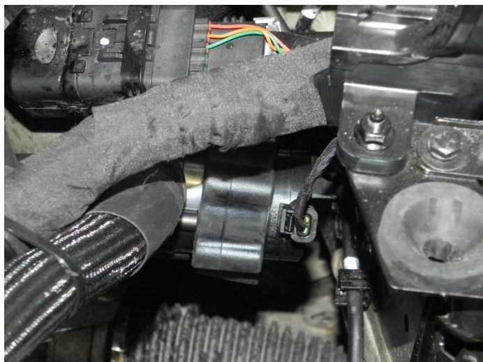
pompa obiegowa wody