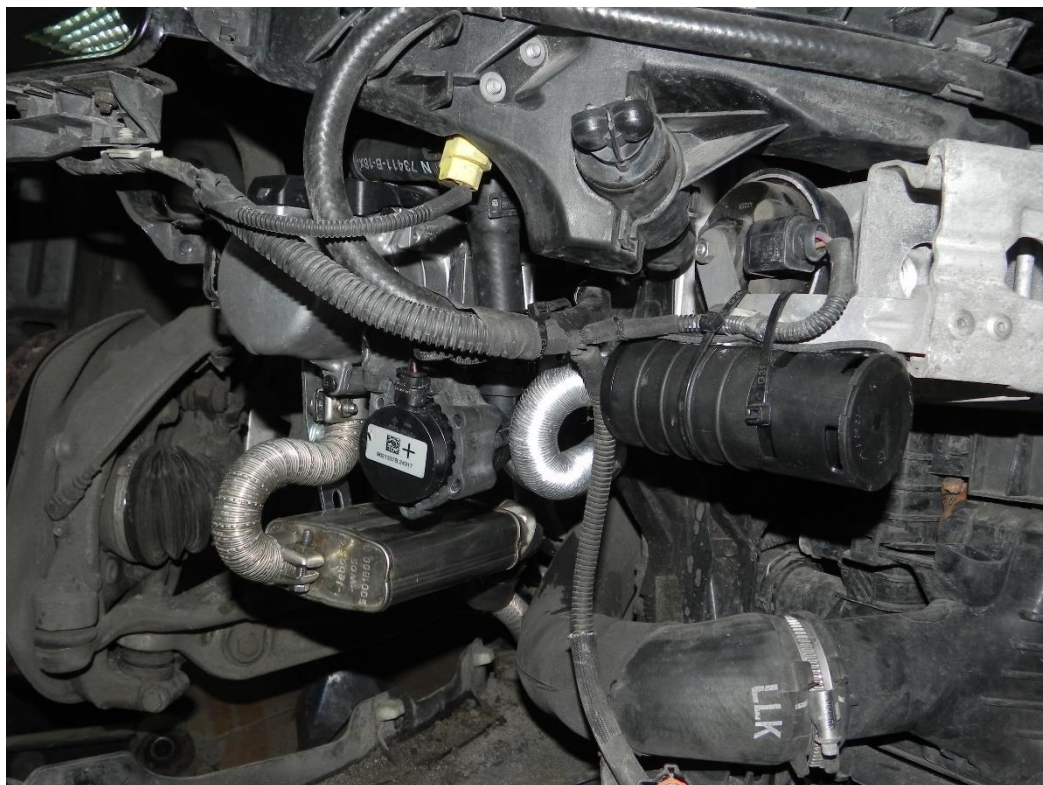
agregat / pompa wody / filtr powietrza / wydech