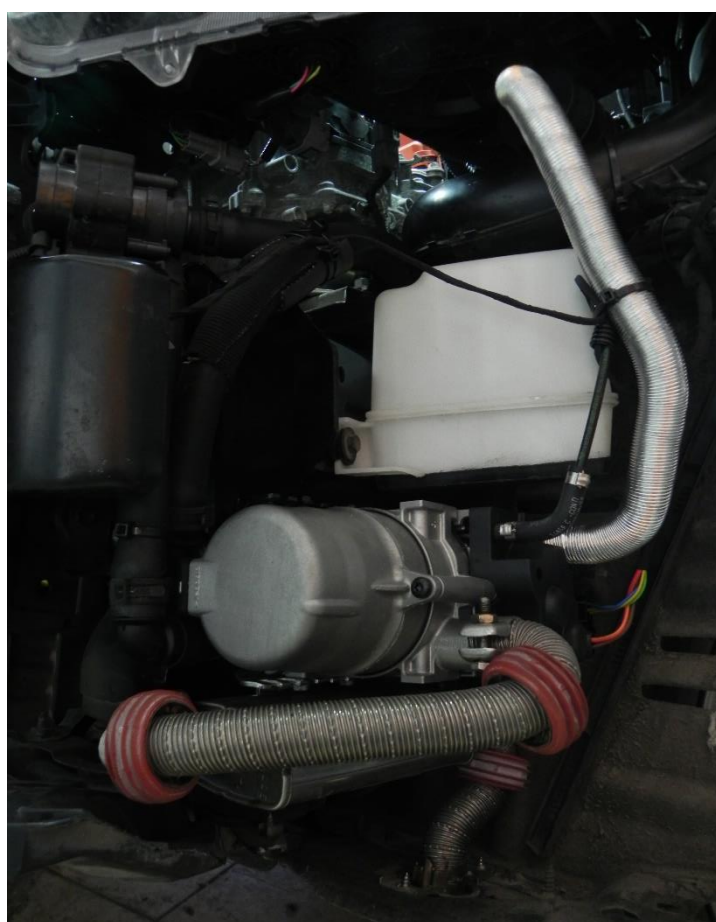
agregat / wydech